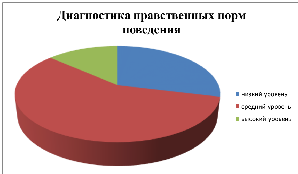
Рисунок 2 – Диагностика сформированности нравственных норм поведения дошкольников.

других людей. Дети этой группы в своих оценках ориентируются только на поведение персонажей, при этом отмечают несоответствующий внешний вид, но пытаются оправдать его. В их ответах наблюдаются развернутые речевые дополнения и аргументация своего мнения.