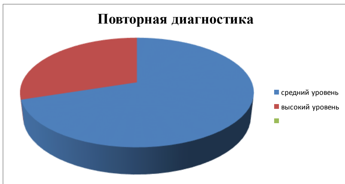
Рисунок 3 – Результаты повторной диагностики сформированности нравственных норм поведения детей старшего дошкольного возраста

На наш взгляд это показатель эффективности проделанной нами работы.