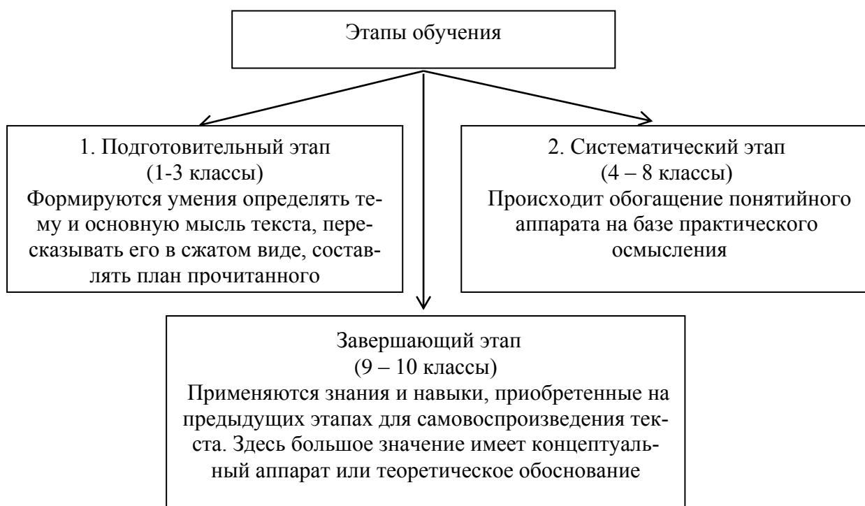
Рисунок 4 – Этапы обучения коммуникативным навыкам

Изложения имеют важное значение в воспитании, интеллектуальном и речевом развитии языковой личности. При написании изложения мы учимся отрабатывать наши языковые умения на практике, а при написании различных типов изложения мы тренируемся использовать данные навыки в полном объеме.