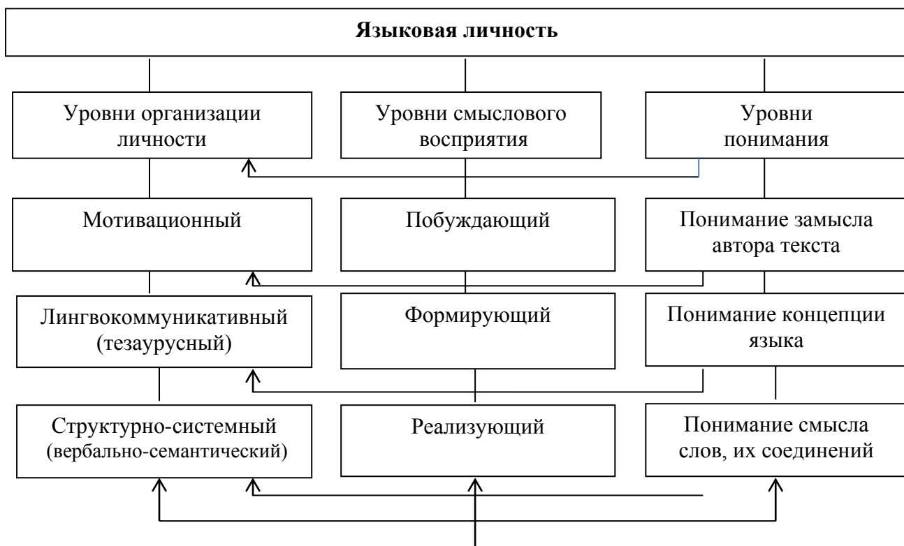
Рисунок 1 – Лингводидактическая модель языковой личности

Особенно интересным в изучении языковой личности является лингводидактическая модель, описанная З. М. Ветчинкиной [5]. На нашей диаграмме мы представим лингвистическую и дидактическую модель личности, на которую ориентированы лингвистические принципы описания языка (см. рис. 1).