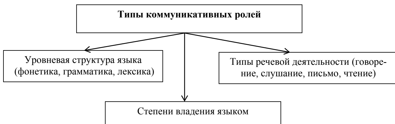
Рисунок 2 – Типы коммуникативных ролей

Структурно-системный включает в себя набор навыков (готовность) для реализации различных видов познавательной деятельности. Лингвистически-коммуникативный характер характеризуется использованием различных типов коммуникативных ролей. На рисунке 2 представлено как на мотивационном уровне происходит воссоздание личности в трехмерном пространстве.