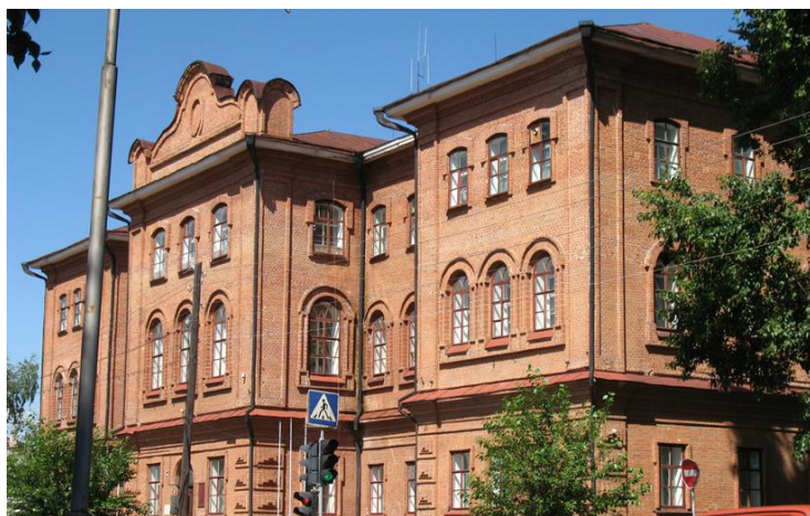
Школа №1 им. И.П.Кытманова