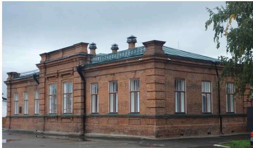
Культурный центр г. Енисейска