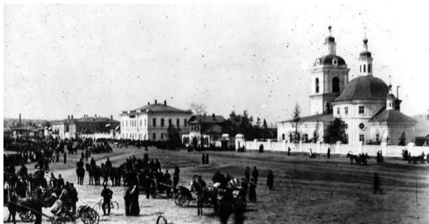
Площадь перед Всехсвятской церковью