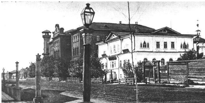
Большая улица Енисейска