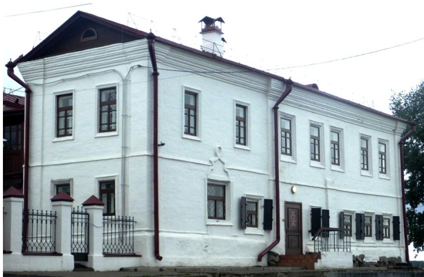
Дом усадьбы Евсеева после реставрации