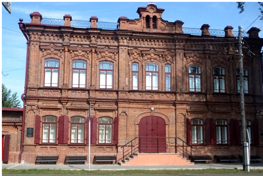
Городской краеведческий музей им. А.И. Кытманова