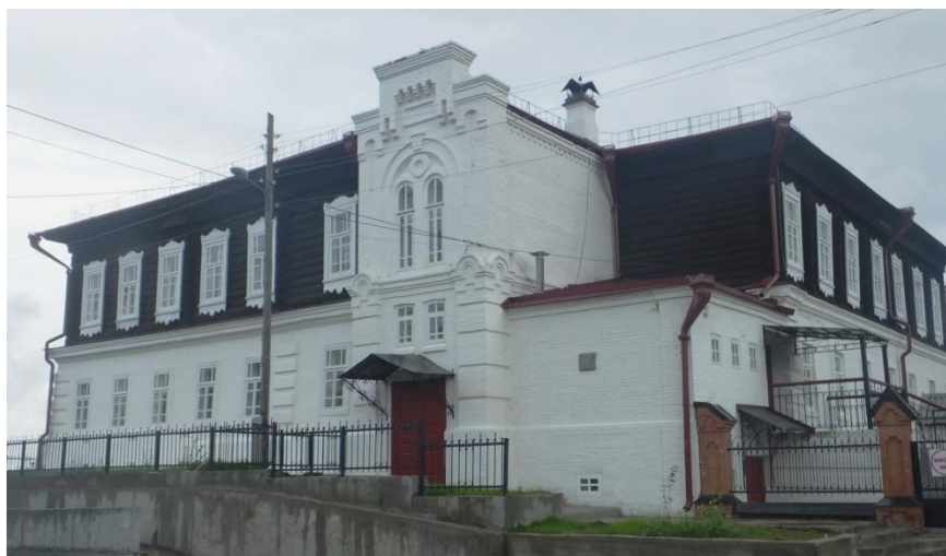
Здание уездного училища после реставрации