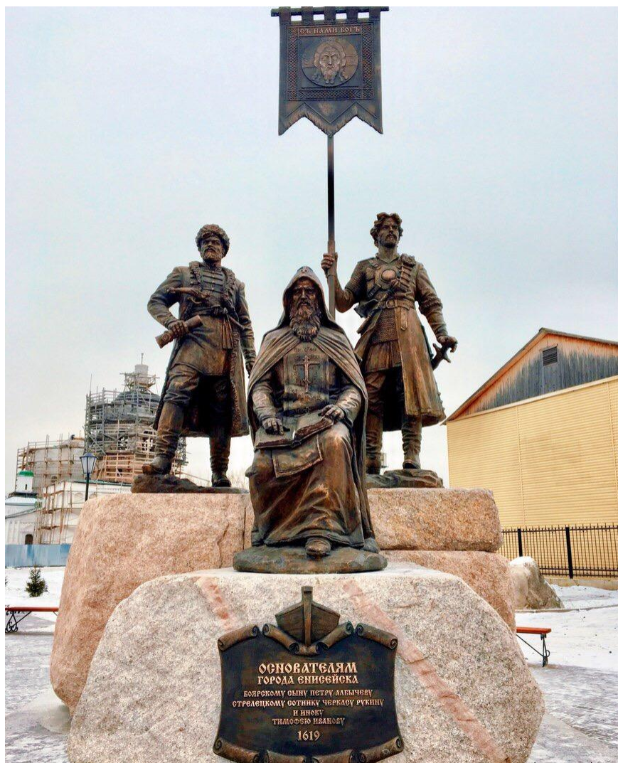
Памятник основателям города Енисейска