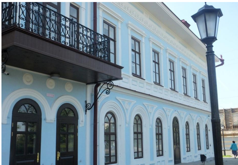
Дом Флеера после реставрации