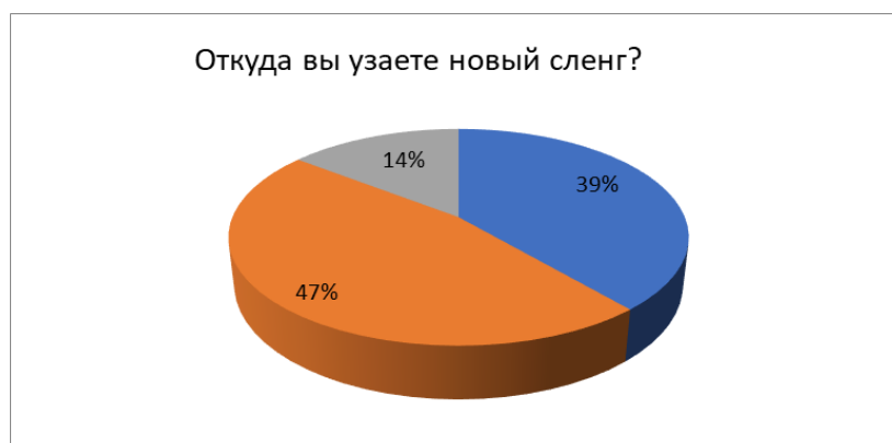
Рисунок 3 – Откуда вы узнаете новый сленг?

Последний вопрос был: «Откуда вы узнаете новый сленг?». 47% опрошенных ответили, что случайно услышали от знакомых; 39% – встретили сленг в социальных сетях; и 14%, что в газетах, журналах и на телевидении (Рис. 3).