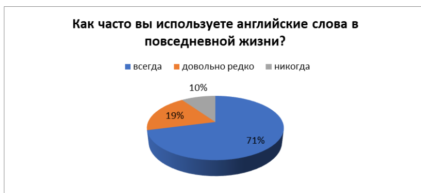
Рисунок 2 – Как часто вы используете английские слова в повседневной жизни?

Последний вопрос был: «Откуда вы узнаете новый сленг?». 47% опрошенных ответили, что случайно услышали от знакомых; 39% – встретили сленг в социальных сетях; и 14%, что в газетах, журналах и на телевидении (Рис. 3).