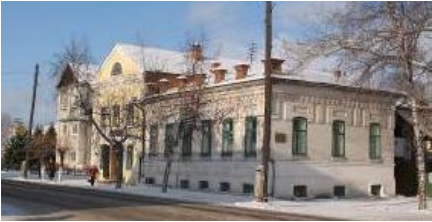
Makarov's house. The end of the 19th century