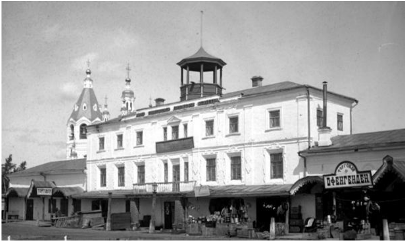
Енисейск в XIX в.