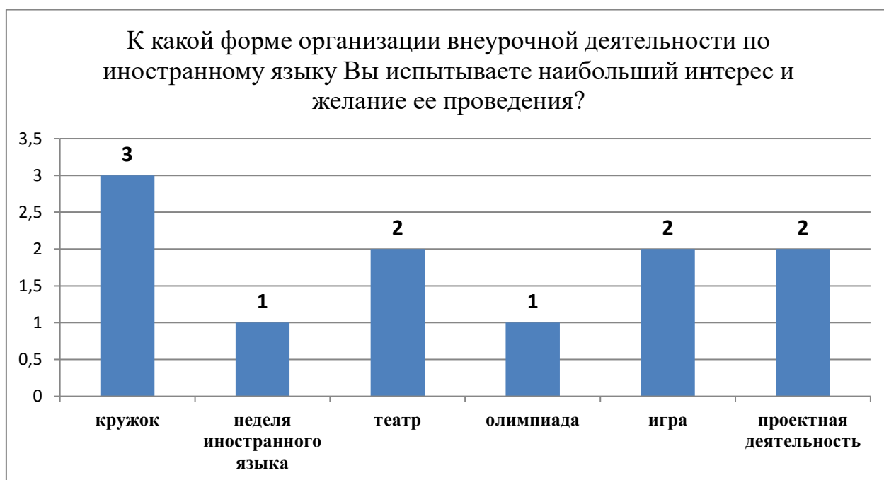
Рисунок 5 – К какой форме организации внеурочной деятельности по иностранному языку Вы испытываете наибольший интерес и желание ее проведения?

В следующем вопросе мы попросили каждого учителя выделить одну приоритетную форму, к которой «лежит душа». Интересующие учителей формы представлены в диаграмме (Рис. 5).