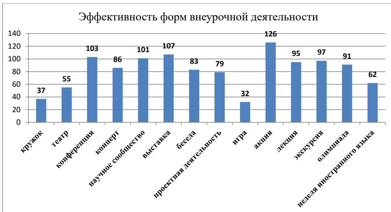
Рисунок 3 – Эффективность форм внеурочной деятельности

Полученные данные демонстрируют, что самой эффективной формой организации внеурочной деятельности, по мнению учителей, является игра (32). Эффективными учителя считают также кружок (37), театр (55), недели иностранного языка (62) и проектную деятельность (79).