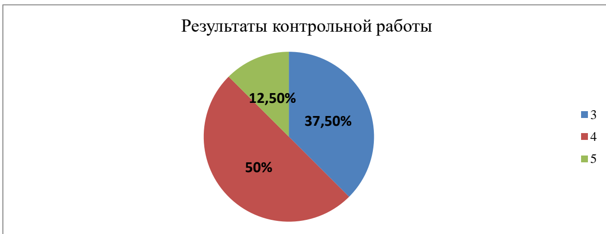
Рисунок 10 – Оценки за контрольную работу в контрольной группе

По окончании опытно-экспериментальной работы, где контрольная группа изучала тему только в рамках уроков, а экспериментальная еще и посещала внеурочные занятия, в классе была проведена контрольная работа по теме « Past Simple ». Проанализировать оценки, полученные учащимися 5А класса, можно исходя из данных, представленных ниже (Рис. 10, Рис. 11).