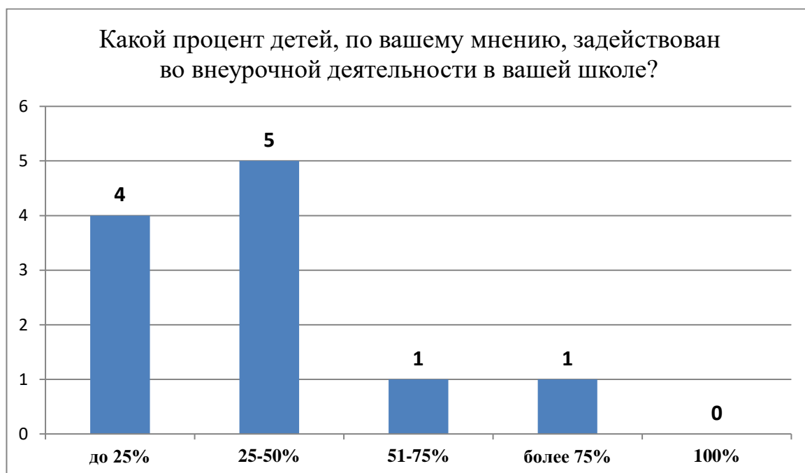
Рисунок 2 – Какой процент детей, по вашему мнению, задействован во внеурочной деятельности в вашей школе?

При ответе на следующий вопрос «Какой процент детей, по вашему мнению, задействован во внеурочной деятельности в вашей школе?» мнения опрошенных педагогов разошлись. Полученные на данный вопрос ответы мы представили в диаграмме (Рис. 2).