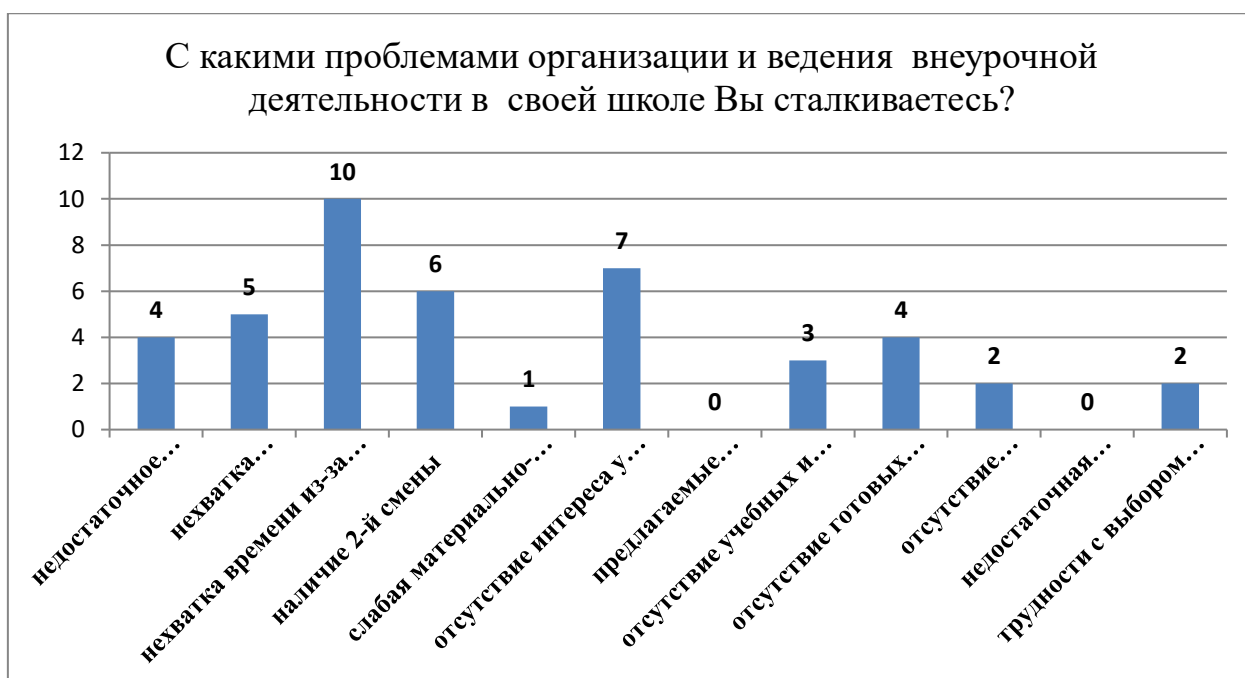
Рисунок 7 – С какими проблемами организации и ведения внеурочной деятельности в своей школе Вы сталкиваетесь?

Разберем ответы учителей. 10 из 11 опрошенных педагогов одной из выбранных причин отметили нехватку времени из-за большой нагрузки. Мы могли бы связать такую загруженность с тем, что в школах не хватает учителей английского языка, однако, нехватку педагогических кадров как проблему, отметили всего 5 учителей.