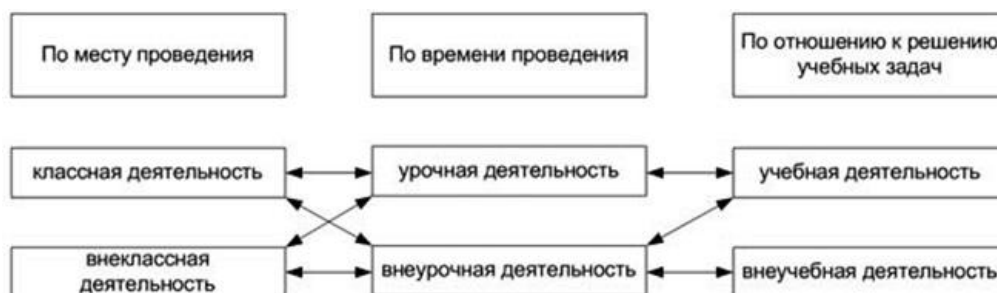
Рисунок 1– Взаимосвязь классификаций деятельности обучающихся.

В статье Е. А. Булаховой [5] представлена классификация видов деятельности и их взаимосвязь.