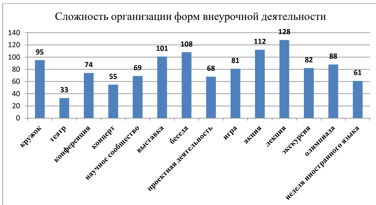
Рисунок 4 – Сложность организации форм внеурочной деятельности

Подсчет финальных данных производился таким же способом, что и в предыдущий раз. Полученные в итоге суммарные данные отражены в диаграмме (Рис. 4).