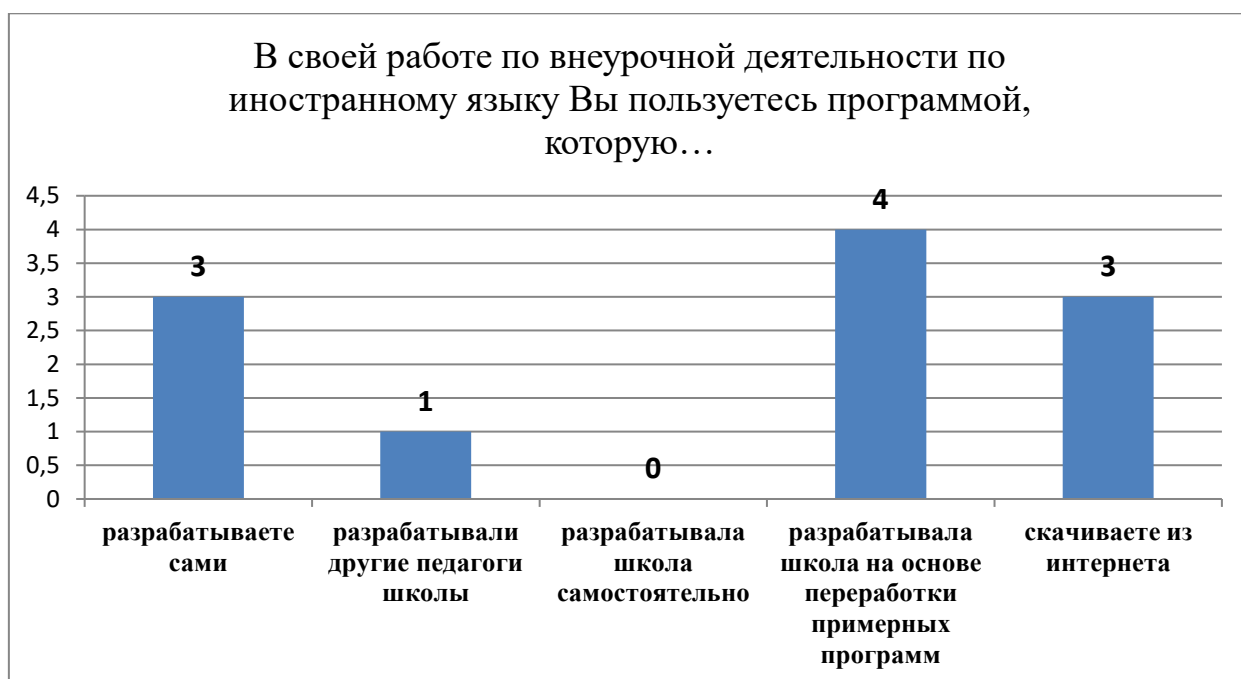
Рисунок 6 – В своей работе по внеурочной деятельности по иностранному языку Вы пользуетесь программой, которую...

В следующем вопросе мы выяснили, с какими программами по внеурочной деятельности работают опрашиваемые учителя. Мы предложили 5 вариантов ответа, из которого нужно было выбрать один. В следующей диаграмме (Рис. 6) мы можем проследить выбор учителей.